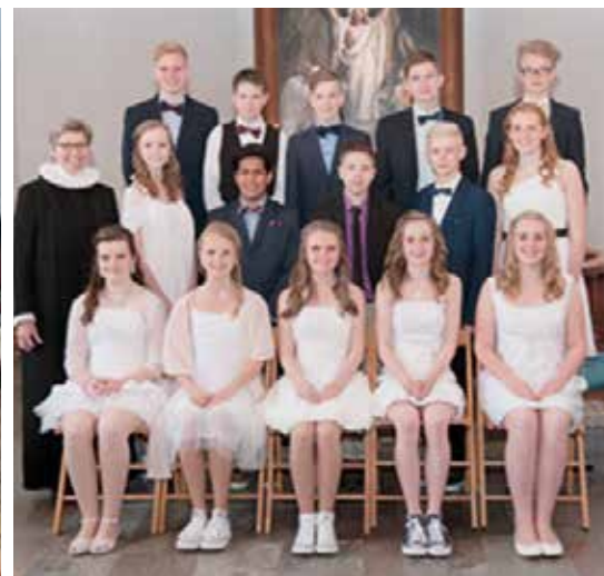
og i Uldum